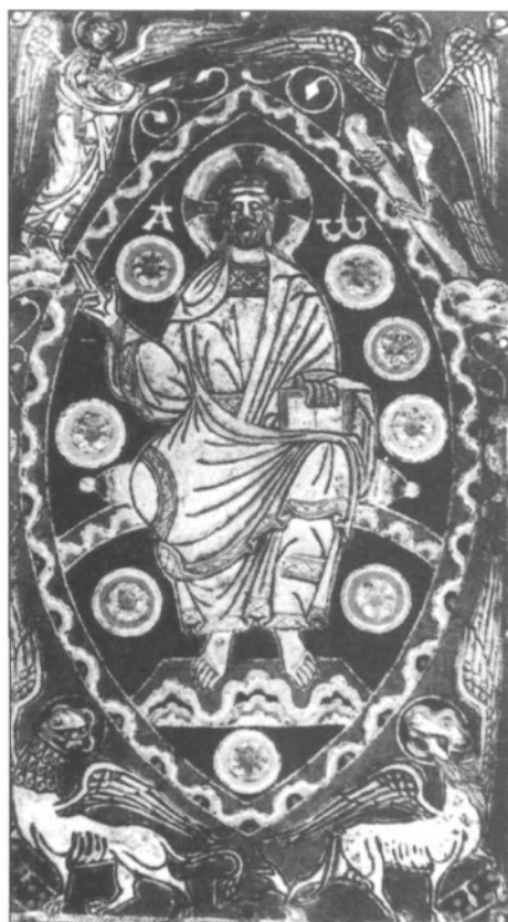
Fig. 5: Limoges, placa de esmalte (Baltimore, Walters Art Gallery).