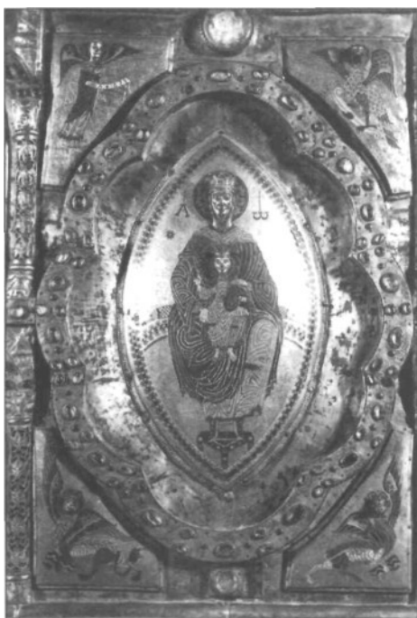
Fig. 4: Frontal de San Miguel de Aralar, detalle.