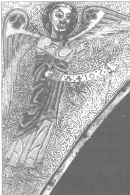
Fig. 2: Frontal de San Miguel de Aralar, detalle.