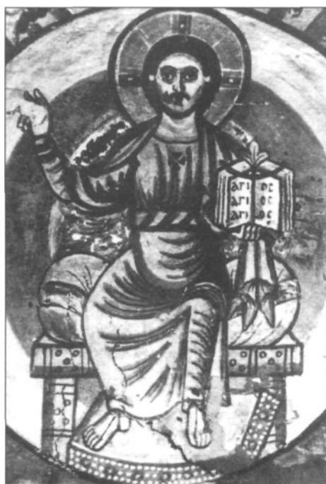
Fig. 6: Convento de San Apolonio en Bait, fresco de la capilla 6 (El Cairo, Museo Copto).