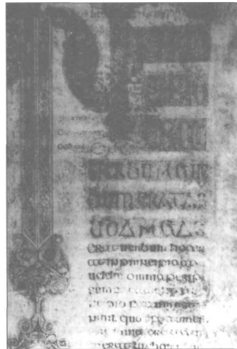
Fig. 3: Libro de Durrow, fol. 193 (Trinity College, Dublin MS A.4.5).